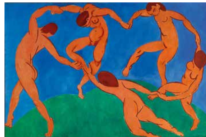
(“La danza” di Henri Matisse)